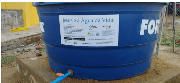
Caixa Principal Instalada