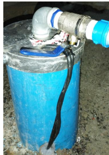
Saída do Poço