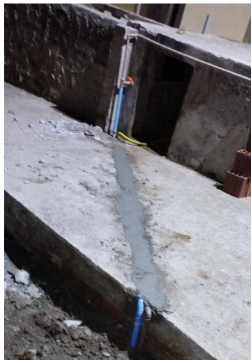
Ligação para Cisterna do Projeto e da Igreja