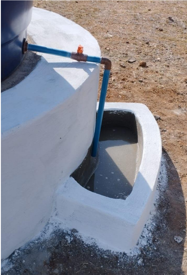
Bebedouro para animais