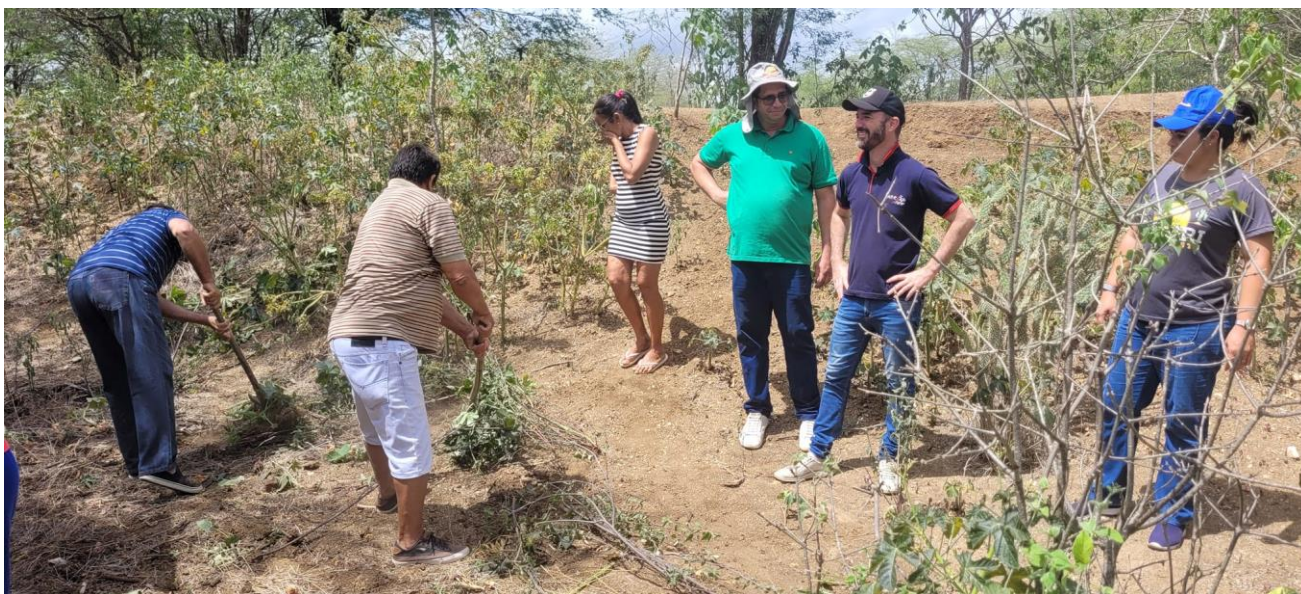
Limpeza do Terreno para passagem dos caminhões