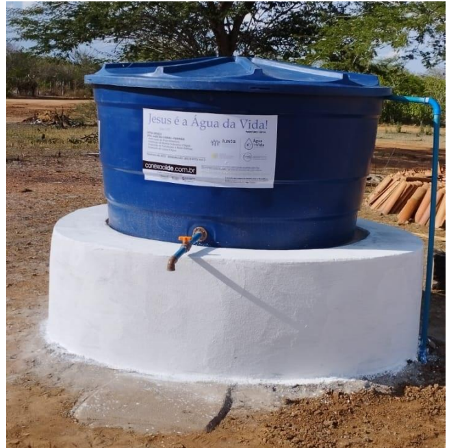
Xafariz para a comunidade