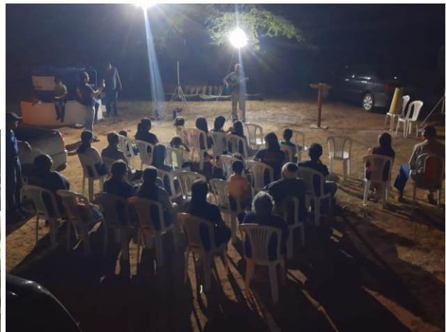
Culto de Gratidão

Nossa Gratidão ao Senhor nosso Deus pelo resultado desta ação e a cada irmão, parceiro e mantenedor da Junta Missionária de Pinheiros e aos Irmãos da Igreja Presbiteriana de Pinheiros. Certamente cumprir-se-á em vossas vidas o cuidado e provisão do Senhor assim como Ele o fez ao povo e irmãos de Boa Esperança através do nobre gesto dos irmãos.