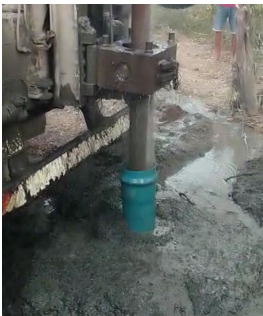
Momento em que a água jorra